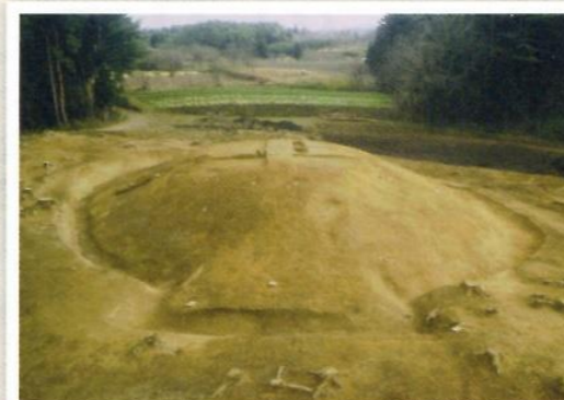
▲郡山で最初に造られた前方後円墳(北山田2号墳)