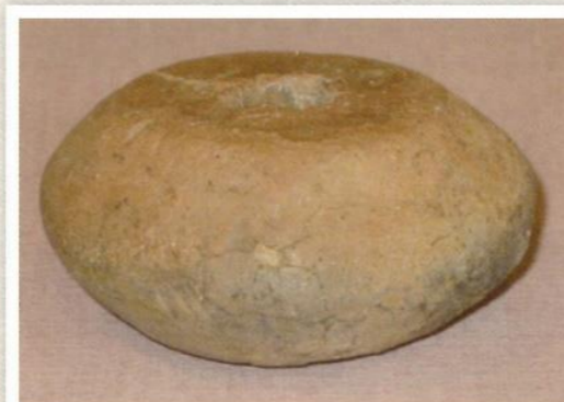
▲朝鮮半島系の糸紡ぎの重り(清水内遺跡出土)