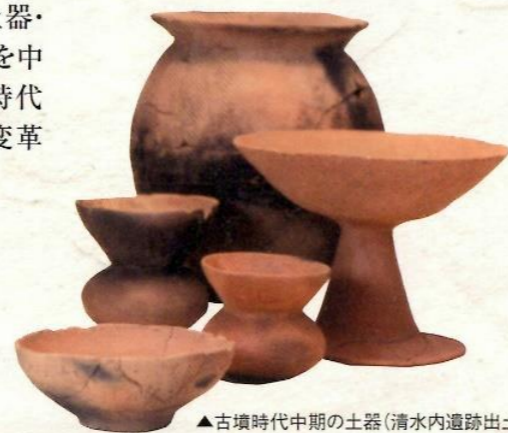
▲古墳時代中期の土器(清水内遺跡出土)

郡山市の古墳時代中期の遺跡からは、朝鮮半島に由来する品がいくつも見つかっています。当時の人々の交流の広さや深さがうかがえます。