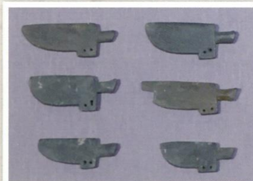
▲祭祀に使われた石製模造品(正直27号墳出土)