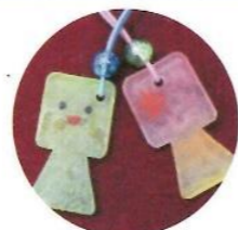
古墳のストラップ