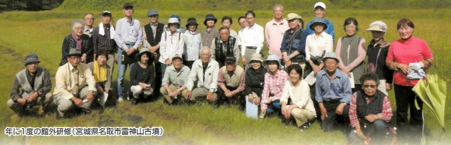
年に1度の館外研修(宮城県名取市雷神山古墳)

今年は大安場史跡公園が全面開園して10周年という記念の年です。ボランティア活動は、全面開園と同時に始まったので、同じく10周年を迎えたことになります。そこで本号では、ボランティア活動10年の歩みを集めました。なお、本号の内容は、下記の期間実施する記念展示とリンクする内容です。この機会に大安場史跡公園へお越しいただき、ボランティア活動の歩みに触れてみてください。