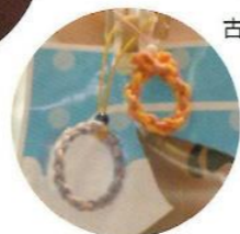
縄文原体ストラップ