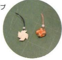
石畳折りストラップ